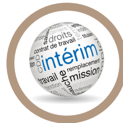
NEW DEAL AFRICA Responsable financier, RH et Administratif et responsable Intérim